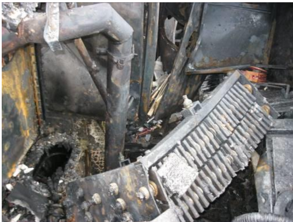
Foto nr.3 - zona TP rezistențele de trecere