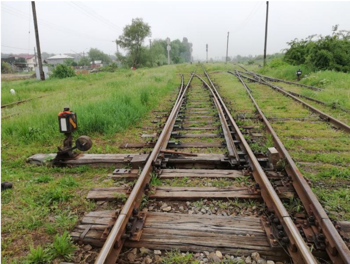
Figura 5 Macazul nr. 4 talonat