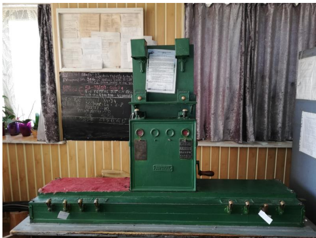
Figura 5 - Bloc SBW Biroul de mișcare

Halta de mișcare Holboca este înzestrată cu instalații de asigurare cu încuieturi și bloc tip SBW + CELS, cu semnale luminoase.