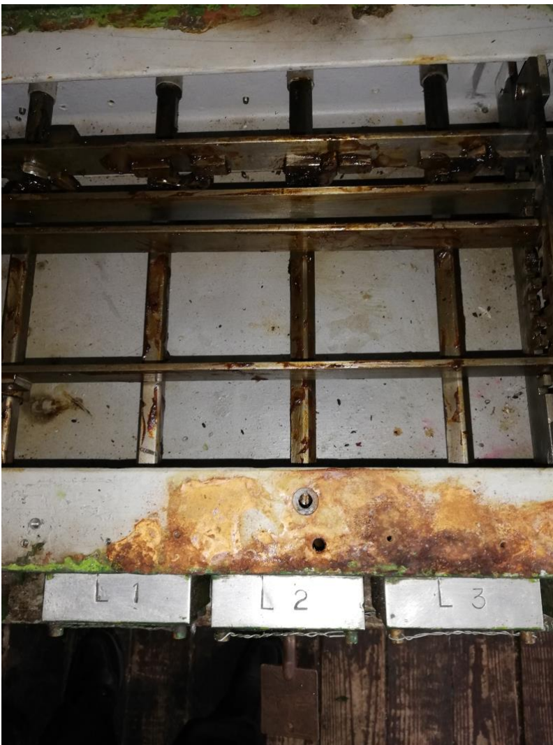
Figura 4 Aparatul de manevră cabina 2 după incident