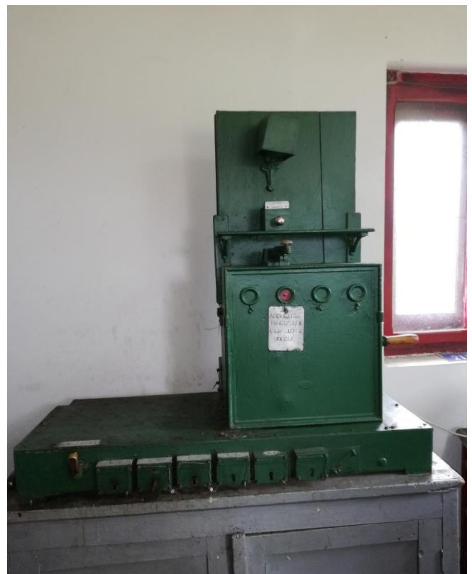
Figura 6 - Bloc SBW cabina 2