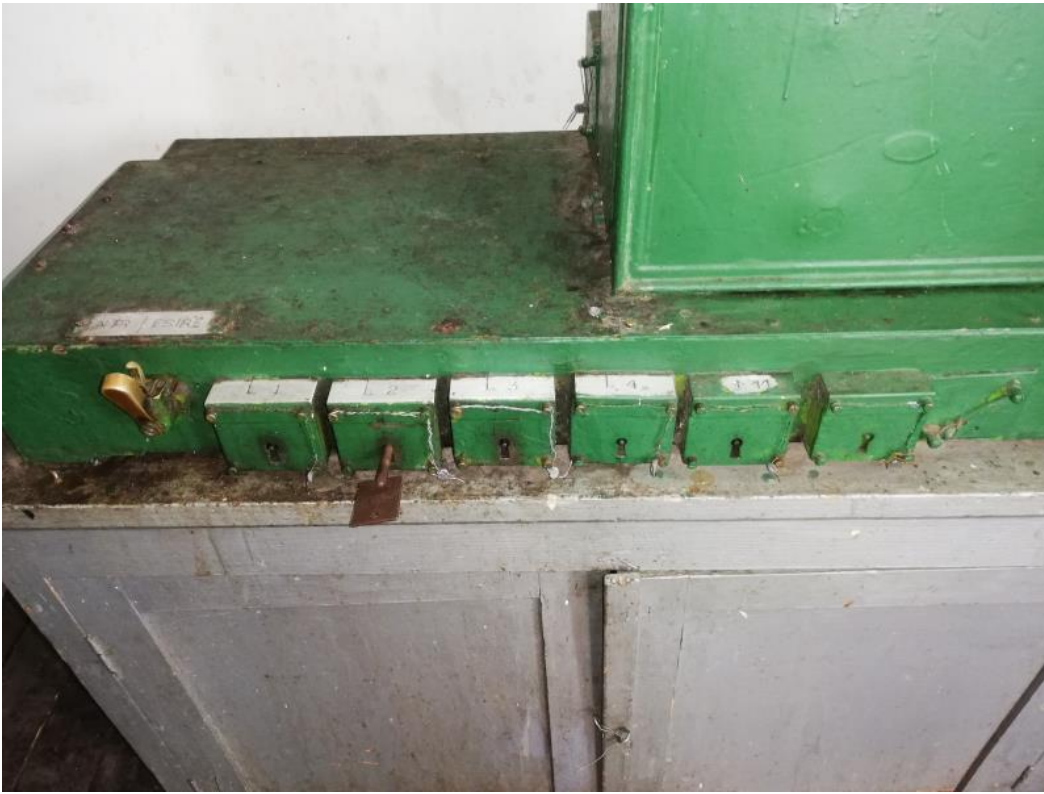
Figura 3 Aparatul de manevră cabina 2 după incident