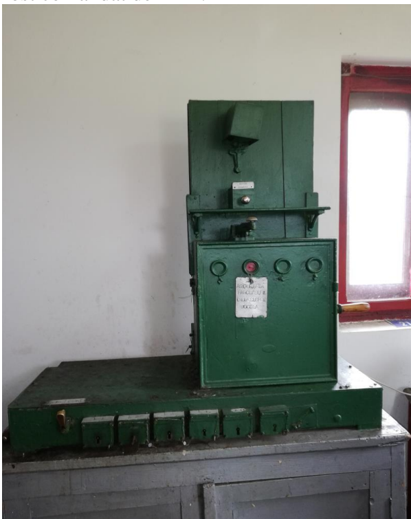
Figura 2 Aparatul de manevră cabina 2 după incident

Instalația de interblocare SBW, circuitele de dependență și de comanda au permis ca semnalele de intrare Y și de ieșire YIII să se poată manipula de către impiegatul de mișcare în poziția de liber (VERDE) fără ca acarul de la cabina 2 să efectueze parcursul de ieșire corect, de la linia III, așa cum a fost comandat de IDM.