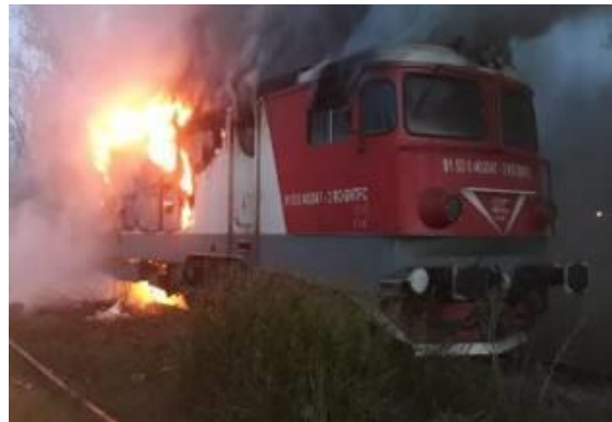
Foto nr.11 – Evoluția în timp a modului de propagare a incendiului