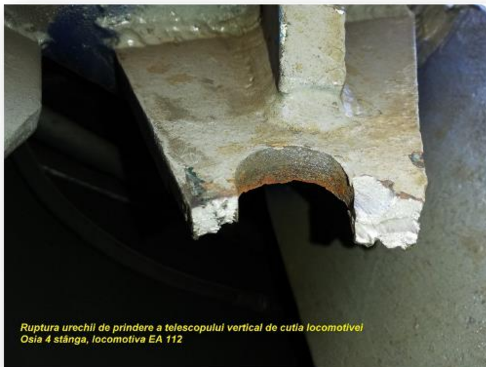
Foto 1 – Subansamblul de prindere a amortizorului vertical de pe cutia locomotivei, ruptă