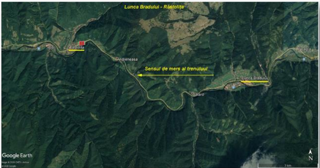
Imagine satelit : traseul de cale ferată Lunca Bradului – Răstolița

După sosirea în stația CFR Deda, la data de 05.04.2020, ora 19:40, locomotiva a intrat în PÎI Deda, pentru efectuarea verificării tehnice la canalul de revizie. Cu această ocazie, personalul de locomotivă și personalul de serviciu pe procesul tehnologic, nu au depistat piese lipsă la locomotivă și nici alte probleme care să afecteze siguranța circulației, întocmind fișa de revizie fără observații și declarând locomotiva „aptă de serviciu” la ora 20:10.