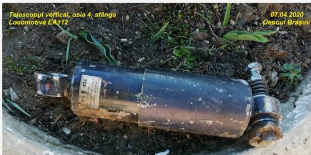
Foto 2 – Amortizorul vertical desprins, al osiei 4, partea stângă în sensul de mers