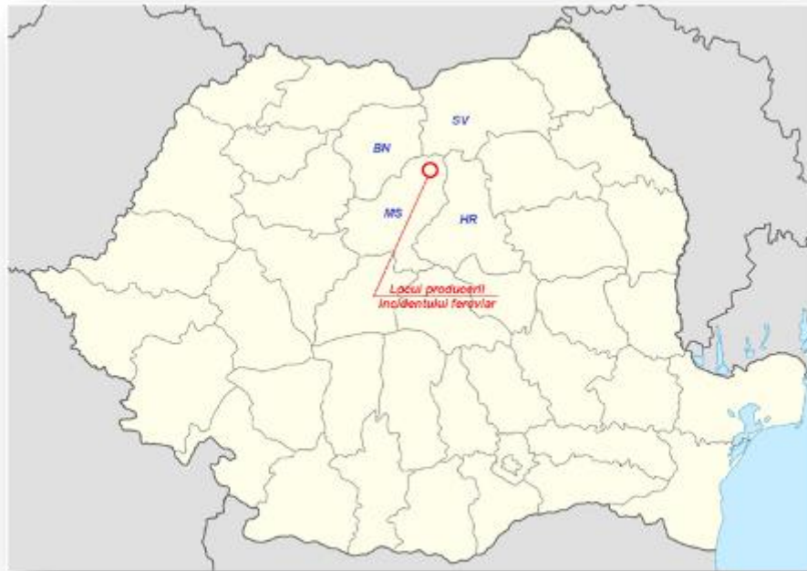
Fig.1 – Locul producerii incidentului