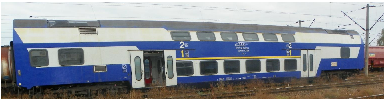
Vagonul 50533616029-4 (al 2-lea din corpul trenului )

Prima urmă a deraierii, a fost constatată pe șinele de legătură ale schimbătorului de cale nr.31, la o distanță de 15,95 m de prima joantă a sch.nr.31 (de vârful sch.nr.31) și este o urmă de cădere între firele căii a roții din partea stângă, a primei osii (roata nr.8) a vagonului nr.50533616029-4, vagon aflat al doilea în corpul trenului.